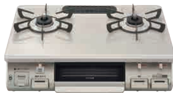
●【リンナイ】ワンピースストップ ガステーブルコンロ 水無片面焼 プロパン/都市ガス RT64JH7S2-C (L/R) [税込・送料込] 25,542円