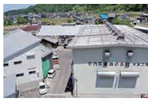
木津工場 新潟県小千谷市木津甲2081番地 TEL 0258-82-6610 FAX 0258-82-6833 敷地:10,129㎡ 建物:3,151㎡