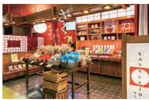
竹内製菓セレクトショップ 臈月堂 新潟県小千谷市本町二丁目1-5 商工福祉会館一階 TEL 0258-83-3456 FAX 0258-86-5077 WEB https://takeuchiseika.shop-pro.jp/

わたしたち竹内製菓株式会社は、1946年の創業以来、今年で78年目の年を迎える運びになりました。これもひとえに、皆様方の厚いご支援と温かい激励の賜と深く感謝いたします。長年蓄積されたもち米菓造りの技術とノウハウを活かし、お客様の様々なニーズにお応えすることがわたしたちの使命です。今後も「あられ、おかし、ひとすじに」をモットーに、皆様に愛され続ける会社であるよう努力邁進してまいります。