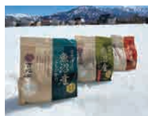
■雪温精法 水温熟成スタンダードパックシリーズ

お米を一定期間マイナス2℃で熟成し、アミノ酸含有率の増加と単糖化を促しながら、旨みや甘みを向上させます。熟成により米粒内に分散する水分が均一に行き渡り水分バランスも整うので、白くつややかで、もちもちした食感のおいしいごはんが炊き上がります。