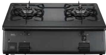
●【ノーリツ】ガステーブルコンロ グリルレス プロパン/都市ガス NLC2296QBA (L/R) [税込・送料込] 18,370円