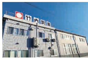
本社工場 新潟県小千谷市穠生乙1672番地 TEL 0258-82-2596 FAX 0258-82-4665 E-MAIL info@takeuchiseika.com 敷地:2,872㎡ 建物:2,212㎡

8つの小千谷を代表する名所・名産(錦鯉・牛の角突き・おぢや縮・小千谷風船一揆・こしひかり・片貝花火・豪雪・信濃川と河岸段丘)をパッケージにデザインし、すべての絵柄の裏側には共通して小千谷の観光名所の地図を掲載しております。中身のあられ・おかしは、国産水稲餅米のみを使用した8種類の味が楽しめます。