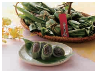
●越後名物 笹だんご【セイヒョー】 [税込・送料込] 3,100円