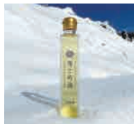
圧搾一番しぼり▶雪こめ油

窒素充填や密封の過程で、酸素濃度をできるだけ低くして鮮度を保ち、精米したてのおいしさを長持ちさせます。店頭での販売期間を長く設定できるほか、賞味期限を明記することで食品ロス削減にも努めています。