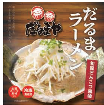
●だるまラーメン 2人前 (冷凍)和風とんこつ醤油【だるまや】 [税込・送料込] 2,580円