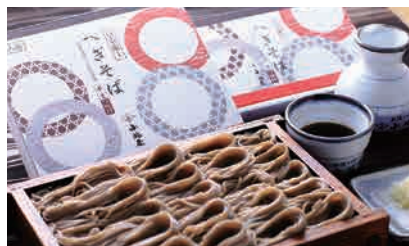
●半生へぎそば 2人前【十日町小嶋屋】 [税込・送料込] 1,830円