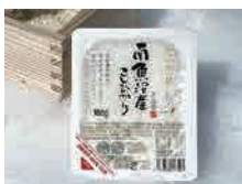
■雪温精法水温熟成南魚沼産こしひかりパックごはん