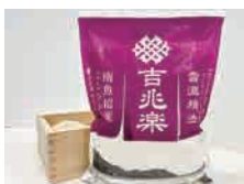
■雪温精法 全国シリーズ