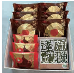
●和菓子詰合せ 10個入【本高砂屋】 [税込・送料込] 3,974円