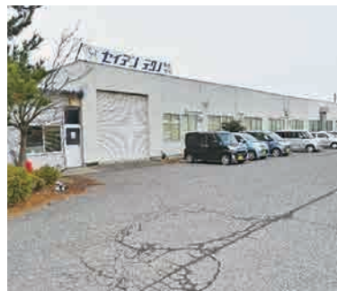
セイデンテクノ社屋

当社の製品は世界的にも宇宙開発の先端を行くJAXA(宇宙航空研究開発機構)のロケットや人工衛星などにも利用され、その他にも防衛、自動車、産業機器、建設機器、鉄道などの分野で幅広くご利用いただき、当社の信頼性は各社から高い評価を得ています。今後、弊社の戦略としては既存事業の効率化だけでなく、産学連携による製品開発や太陽光・風力発電などの環境エネルギー分野にも積極的に進出していくとともに品質保証体制を更に強化することで今後も時代のニーズに対応し、22世紀へ向けて飛躍していきます。