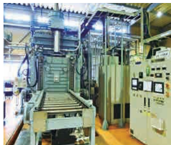
三室型真空熱処理炉

自動車、農機具、建設機械、産業機械、工具など、当社はありとあらゆる分野のものを熱処理しています。金属熱処理はお客様から素材をお預かりし、付加価値をつけてお届けする仕事。お客様のニーズにお応えする事が、当社の使命で有ると考えています。