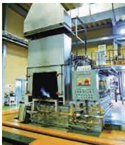
オールケース型浸炭炉